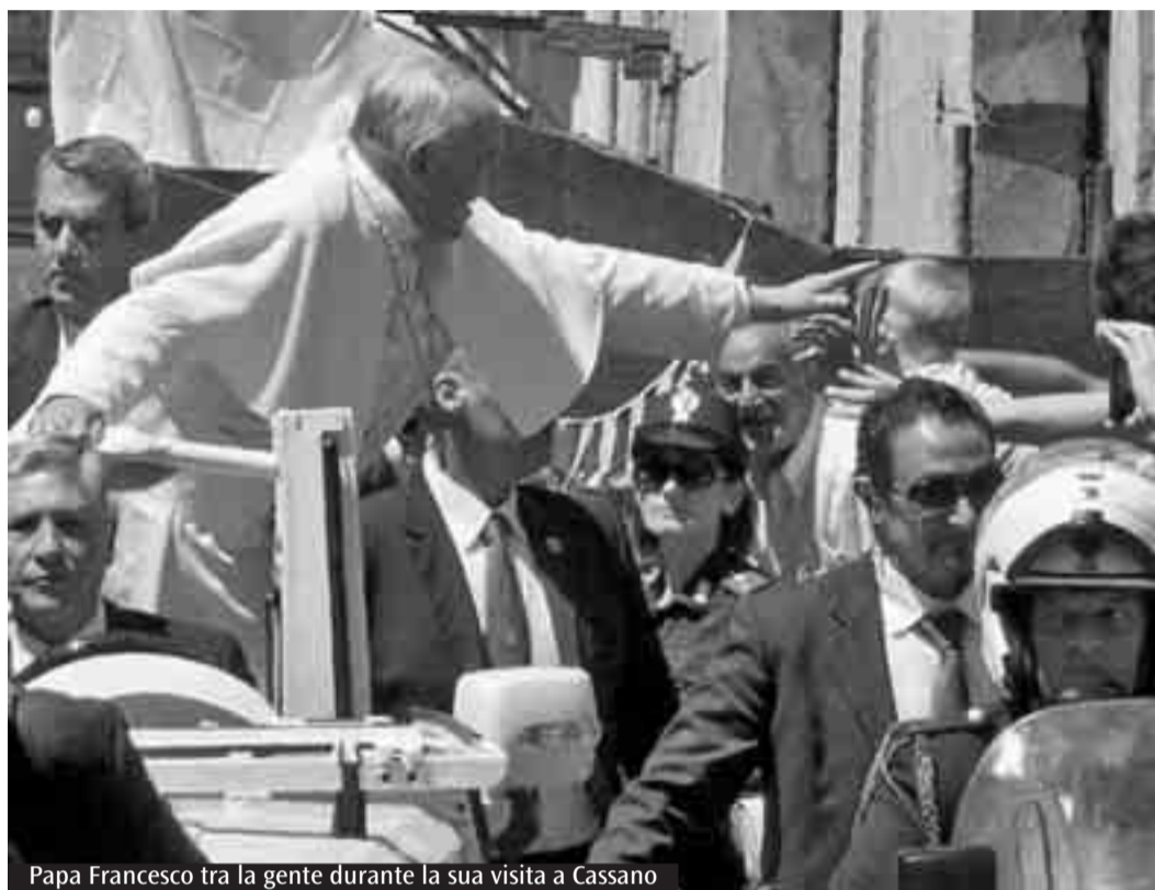
Papa Francesco tra la gente durante la sua visita a Cassano