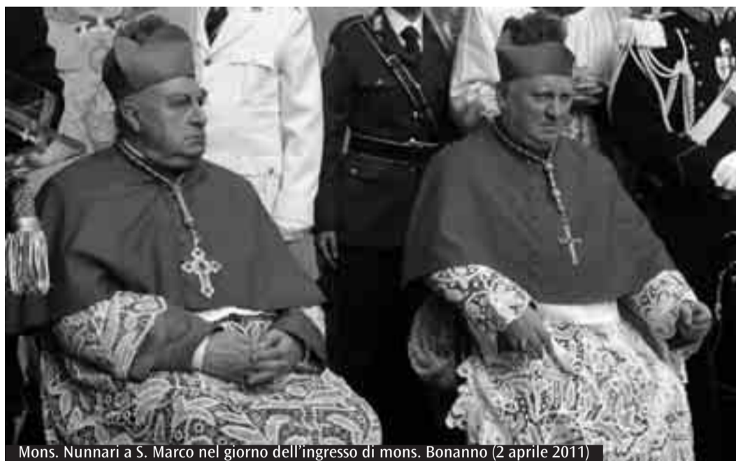
Mons. Nunnari a S. Marco nel giorno dell'ingresso di mons. Bonanno (2 aprile 2011)

La pagina diocesana di Avenire, come di consueto, sospende, per il periodo estivo, la pubblicazione quindicinale. Riprenderà la pubblicazione da settembre. L'Ufficio per la pastorale delle Comunicazioni Sociali della Diocesi, augura ai lettori buone vacanze.