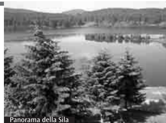
Panorama della Sila