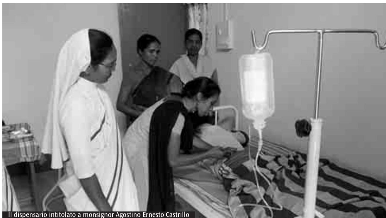
Il dispensario intitolato a monsignor Agostino Ernesto Castrillo

Il vescovo di Khunti, monsignor Estephan esprime tutto il suo ringraziamento per quanto la nostra diocesi sta facendo per la sua gente. Il 19 settembre scorso, è stato celebrato il primo anniversario del dispensario «monsignor Agostino Ernesto Castrillo» in Karra. Facendo il resoconto dell'opera di questo primo anno si può dire che la cura dei malati è stata soddisfatta in diversi modi: prendendosi cura dei sofferenti, accogliendoli nel dispensario, dove ci sono 10 stanze con più lettini, che possono ospitare 25 persone; visitando i malati nei villaggi dopo averne ricevuto segnalazione; andando anche nei villaggi a curare i malati che non sanno o non possono raggiungere il dispensario in Karra; impegnandosi a realizzare il progetto del vescovo locale per la cura dei malati in modo capillare nei tantissimi villaggi della diocesi. Finora non sono stati visitati più di dieci. Le malattie più frequenti sono: la malaria, tifoidea, diarreica e dissenterica. Con i soldi che la Diocesi di San Marco Argentano - Scalea ha mandato nell'anno 2010 è stato comprato un