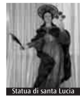
Statua di santa Lucia