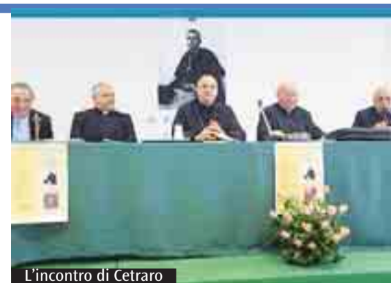
L'incontro di Cetraro

L'ufficio diocesano per la pastorale della famiglia ha programmato tre incontri che si svolgeranno in ciascuna Forania per incontrare le famiglie e vivere con loro un momento di preghiera e agape fraterna. La proposta è stata denominata «Una domenica tra famiglie» per evidenziare il carattere amichevole per uno scambio di esperienza tra famiglie proposto dall'ufficio diocesano per la famiglia che provvederà a curare l'animazione della giornata. Domenica 20 novembre prossimo l'appuntamento è a Belvedere Marittimo (presso la Parrocchia Maria Ss. del Rosario di Pompei) con inizio alle ore 9. Il 22 gennaio toccherà alle famiglie della forania di Scalea (presso la Parrocchia San Giuseppe Lavoratore) e il 19 febbraio per le famiglie della forania di San Marco Argentano (presso la chiesa di San Francesco di Paola al Seminario).