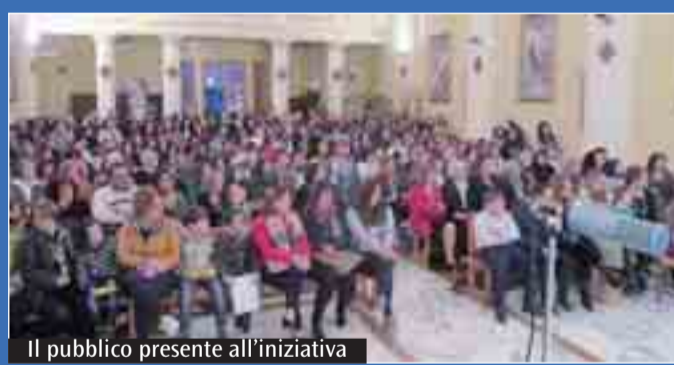
Il pubblico presente all'iniziativa