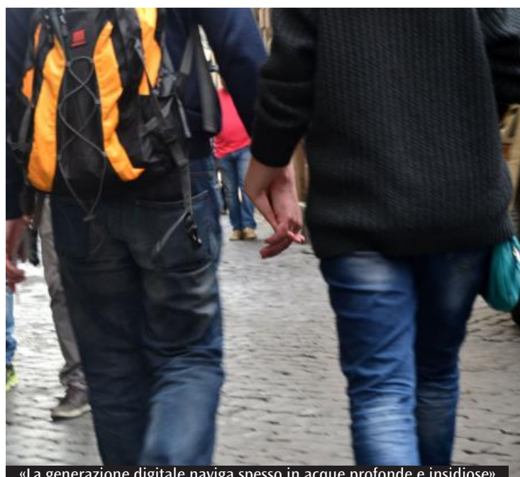
«La generazione digitale naviga spesso in acque profonde e insidiose»

menti offensivi. Il cyberbullismo è un reato e può causare gravi conseguenze. Ognuno pubblica sui suoi profili social ciò che vuole: ma cosa ci dà il diritto di commentare o insultare esprimendo giudizi non richiesti? Dietro ai contenuti social ci sono comunque persone reali, che vivono le loro vite e alcuni commenti potrebbero ferire. I social non devono sostituire la vita reale. Sono utili perché ci aiutano a mantenere i contatti con persone fisicamente distanti o che non possiamo vedere spesso ma, allo stesso tempo, è importante coltivare relazioni vere che pos-