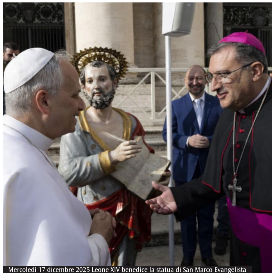
Mercoledì 17 dicembre 2025 Leone XIV benedice la statua di San Marco Evangelista

Il riferimento ai più piccoli non è casuale. In un contesto culturale che rende sempre più difficile la trasmissione della fede alle nuove generazioni, il Vescovo indica proprio questo come una delle priorità pastorali più concrete. Non a caso, l'Anno pastorale in corso nella Diocesi è incentrato sul tema annuale: «Quale missione nel mondo di oggi? Educare con la scuola e la famiglia»; un percorso che pone al centro il rapporto tra comunità cristiana, istituzione scolastica e nucleo familiare come luoghi privilegiati in cui la fede si trasmette, si nutre e cresce. La festa di San Marco diventa allora anche un momento di verifica e di rilancio di questo impegno educativo: non basta solo celebrare, occorre formare, accompagnare, testimoniare ogni giorno e in ogni luogo.